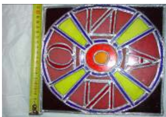
Oeuvre originale de Valérie Fortis

De nombreux vitraux d'églises ou de cathédrales de l'époque médiévale et moderne tirent leurs teintes rouge et bleue de nanoparticules d'or ou d'argent, contenues dans le verre.