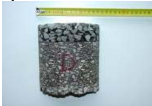
Ciment fotofluid ( http://www.globalengineering.info/ )

Le ciment fotofluid combine à la fois la dureté du ciment et la flexibilité de l'asphalte, il peut donc être utilisé pour recouvrir les routes.